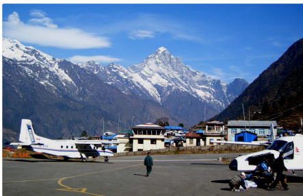
ルクラ空港と聖峰クーンビラ