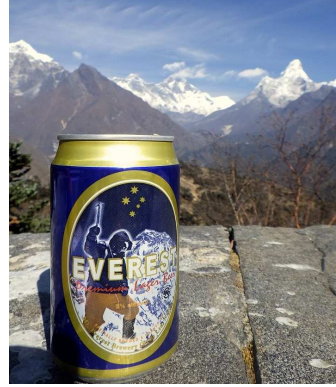
エベレストを眺めながら エベレストビールで乾杯!

エベレスト街道のトレッキングは、昔から使われている村人の生活道路を利用します。山村の暮らしに触れながら歩くこのコースは、往来が多いのでよく整備された歩きやすい道。ドードコシ(ミルクの川)大峡谷を進んでいきます。