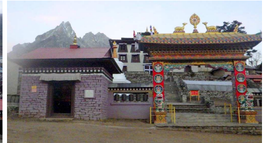
大きな僧院のあるタンボチェ