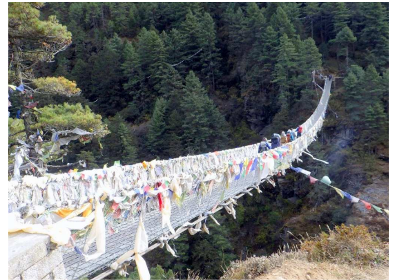
ドードコシ峡谷にかかる吊り橋を渡って

ナムチェバザールはシェルパの故郷。長い吊り橋を渡り、約 600m の登りを頑張ると、高所の斜面に馬蹄形に発展したこの村に到着します。クワンデやクーンビラなど、ヒマラヤの名峰・巨峰を一望する標高 3,450m の村が、このツアーのベースとなります。