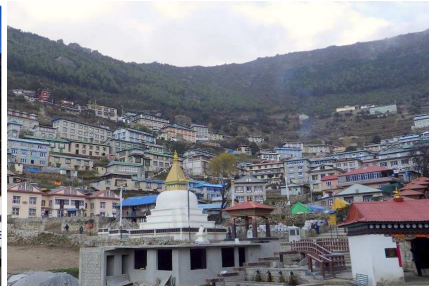
シェルパの故郷ナムチェバザール