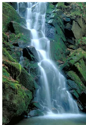
春日山山麓に落ちる鶯ノ滝