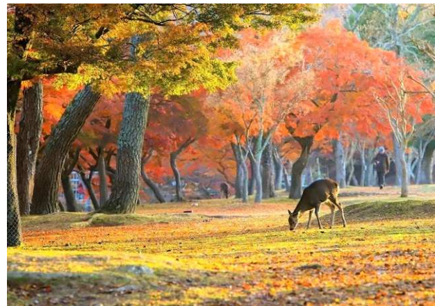
この時期、例年では奈良公園や寺社仏閣の境内は紅葉が見ごろの季節です(イメージ)

香具山は 畝火(傍)ををしと 耳梨(成)と 相あらしひき 神代より 斯くにあるらし 古昔も 然にあれこそ うつせみも 妻をあらそふらしき 『訳:香具山は畝傍山を雄々しいと言って耳成山と相争った。神代からそうらしい。昔もそうだったからこそ、今も愛する人を取り合って争うらしい』 この歌には、中大兄皇子が当代随一の歌人と言われた美女・額田女王を弟の大海人皇子(後の天武天皇)と取りあった…という逸話が伝わります。2日目は、そんな古代日本の歴史秘話やロマンが随所に残る奈良飛鳥路の古道を、ツアーリーダーの解説を交えてのんびりたどります。