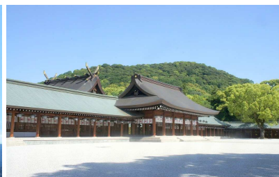
初代天皇とされる神武天皇を祀る橿原神宮。畝傍山麓に鎮座します