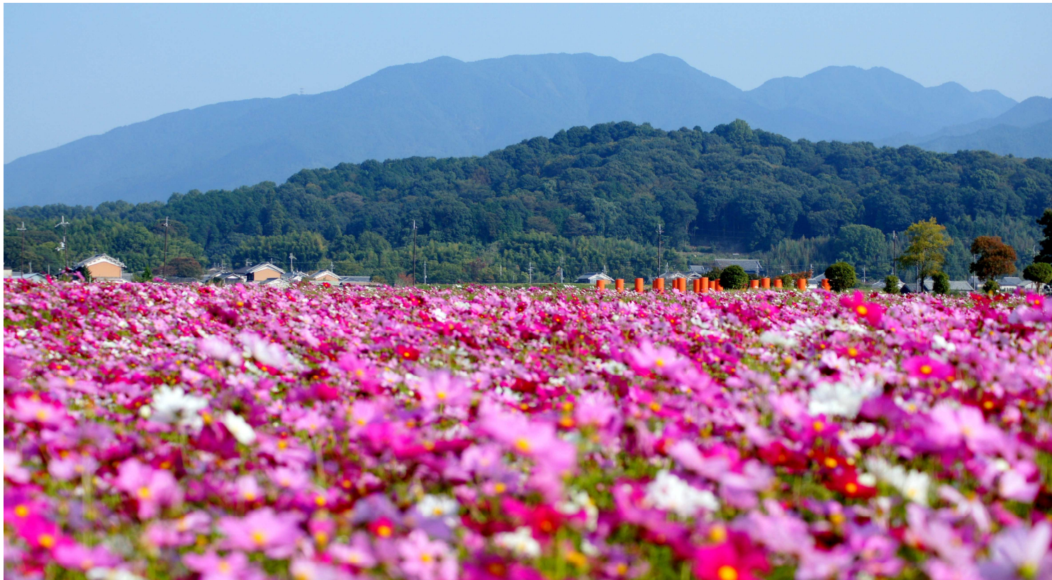
大和三山すべてを見渡す眺望スポットの藤原京跡。例年10月上~下旬はコスモスの花が見頃です(写真手前の山は香久山/イメージ)

旅行代金 おひとり様 138,000円 (新千歳発着) 98,000円 (奈良発着)