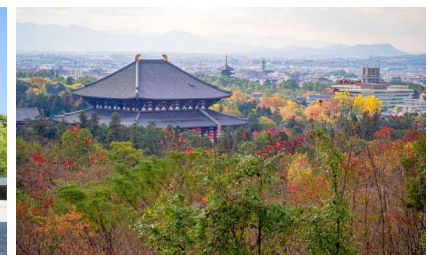
若草山から見下ろす東大寺大仏殿と奈良市街

◀大和三山めぐりでは、奈良の平城京に遷都されるまで古代日本の中核だった日本初の都城・藤原京跡を訪れます。秋晴れの中、広大な遺構をのんびり歩くと1300年前の世界に誘われるようです