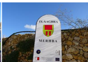
マルタ特有のアルファベットも