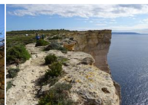
ゴゾ島南海岸のトレイル