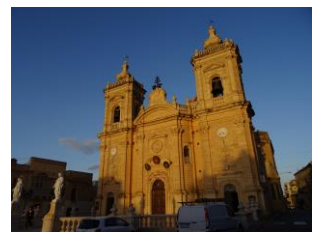
教会や聖堂は数えきれないほど