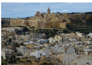
ゴゾ島の中央に鎮座するチタデル