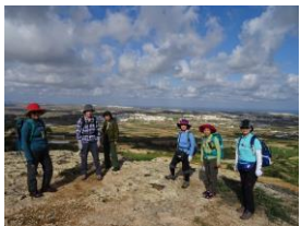
ビクトリアラインズの高台(マルタ島)

※行程は原則として上記を予定しておりますが、現地事情により変更する場合があります。