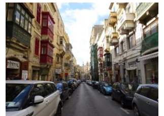
首都ヴァレッタの街並み(マルタ島)