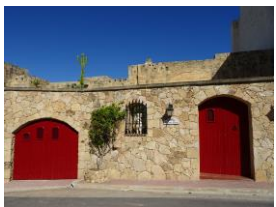
目を惹く建物が多い