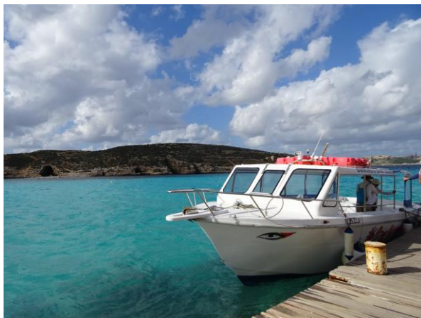
ブルーラグーンの棧橋(コミノ島)