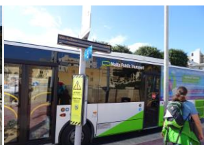
島内全域を網羅するは路線バス