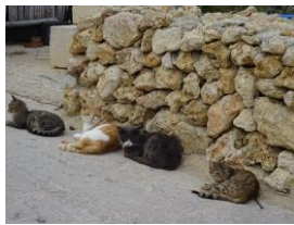
「猫島」の異名も持つマルタ