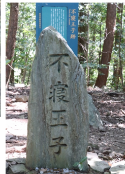
点在する王子社跡の石碑