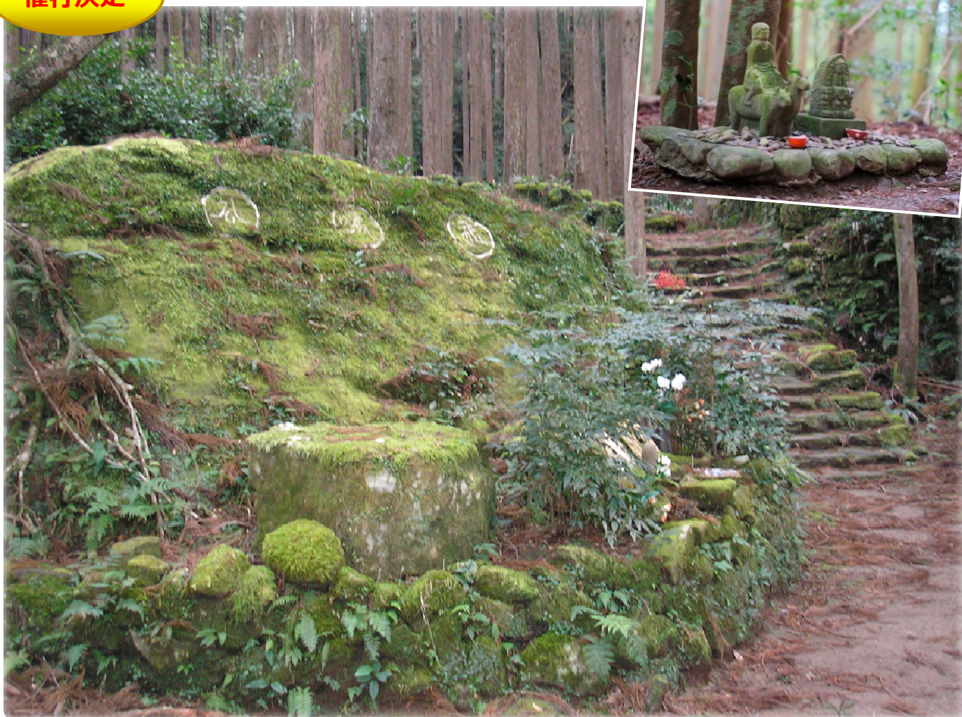
熊野の神々が石の上で語り、談笑したと伝わる円座石(わろうだいし)／大雲取越