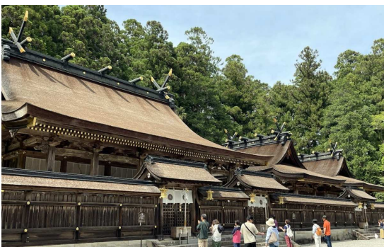
中辺路本ルートのゴール・熊野本宮大社