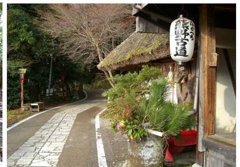
古道の趣を良く残す「とがの木茶屋」界隈