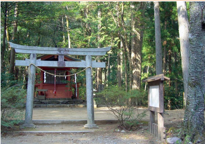
熊野本宮大社の聖域の入口とされる別格の王子社、発心門王子。ここからいよいよ中辺路のクライマックスが始まります