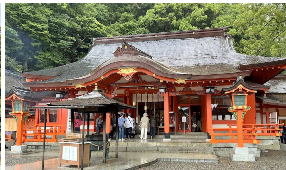
大雲取越のゴール・熊野那智大社