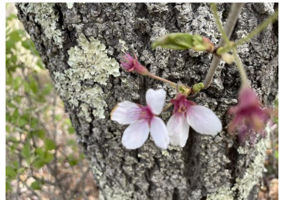
桜の季節、至る所に咲く