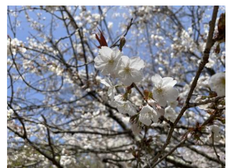
ソメイヨシノほか数種類のサクラ