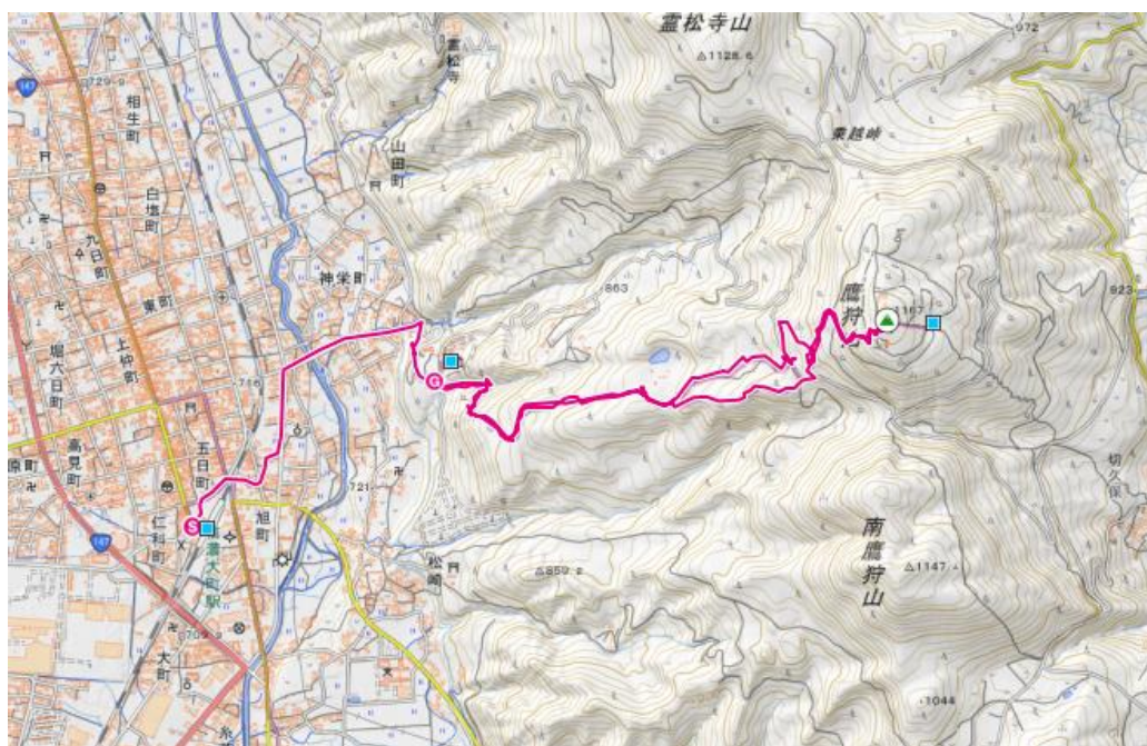
鷹狩山コース概念図

※歩行の行程は原則として上記を予定しておりますが、現地事情により入れ替えや変更が生じる場合があります