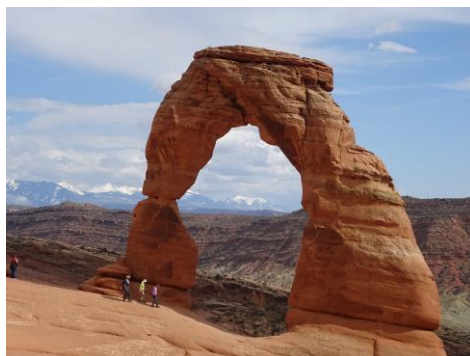
デリケートアーチ(アーチズ国立公園)