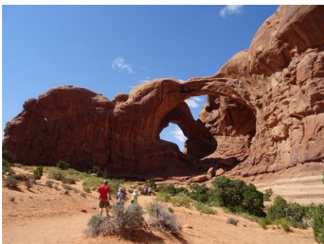
ダブルアーチ(アーチズ国立公園)

世界で初めて法律の下で自然保護を推進した国でもあり、日本の25倍の面積を持つアメリカ合衆国には数多くの素晴らしい原始風景があります。55の国立公園、中でもアメリカ西部には特に多くの国立公園や州立公園があり、西部4州(ユタ州、コロラド州、ニューメキシコ州、アリゾナ州)にまたがる広大な国立公園の宝庫を「グランドサークル」と呼んでいます。グランドサークルには国立公園だけではなく、その景観では引けを取らない多くの州立公園や、名もない荒野にさえ目を見張る大自然の造形が存在します。赤茶けた岩肌には希少かつ壮大な古代インディアンの壁画や、恐竜の骨や足跡の化石も見られます。“グランドステアケース”と呼ばれるコロラド高地は、長年の浸食と風化により、ピンククリフ、ホワイトクリフ、バーミリオッククリフなど6段の色彩豊かな浸食断崖層を生み出しました。このツアーでは、毎日2～4時間程度のハイキングを楽しみ、魅力の尽きない国立公園群をめぐります。「色彩に乏しいただの乾燥した荒野」と思わないで下さい。実際に自分の目で見て、足で歩かなければ分からないアメリカの大自然。それは、期待を超えてあまりある、感動の体験となることでしょう。