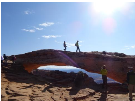
メサ・アーチ(キャニオンランズ国立公園)