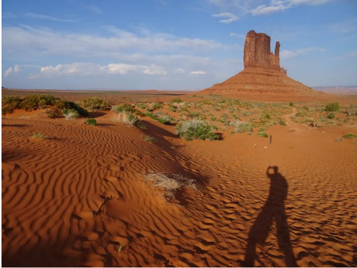
モニュメントバレー