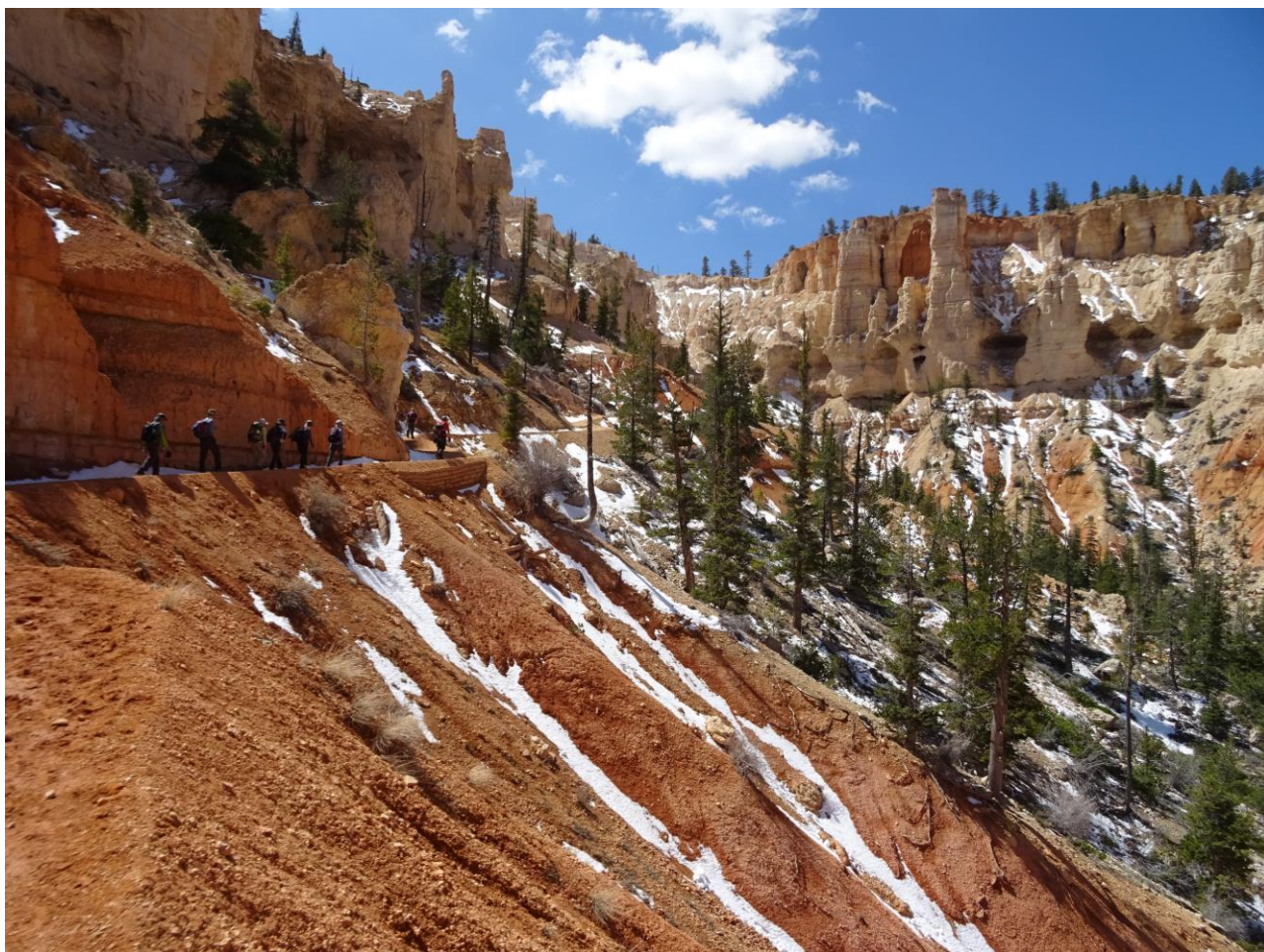
林立するフードゥーの中を行く(ブライスカニオン国立公園)