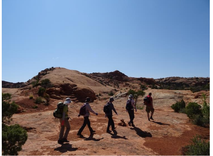
アップヒーヴァル・ドームへ