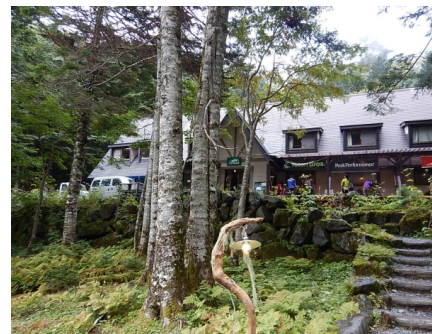
登山ベースとなる北沢峠には何件か山小屋があります(写真はこもれび山荘)

◀雄大なカールを従えた大山容と高山植物の豊かさから「南アルプスの女王」と称される仙丈岳