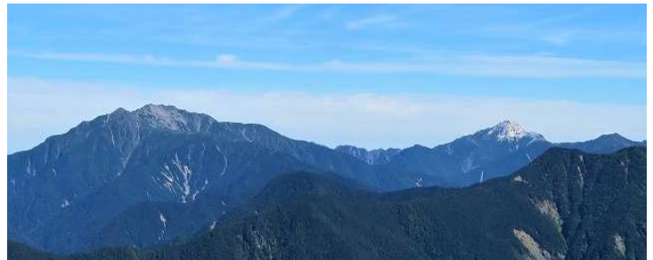
北沢峠を基点に対峙してそびえる甲斐駒ヶ岳(右)と仙丈岳(左)

◀雄大なカールを従えた大山容と高山植物の豊かさから「南アルプスの女王」と称される仙丈岳