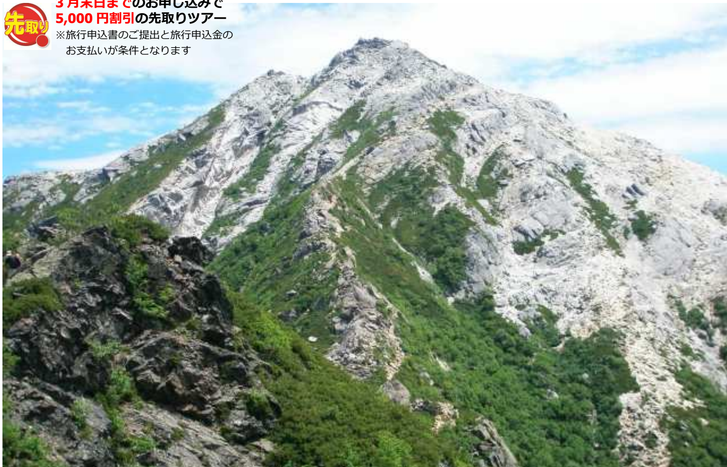
花崗岩の白い岩肌が雄々しい甲斐駒ヶ岳。日本各地にある“駒ヶ岳”の最高峰で、日本百名山の中でも特に人気の高い一座です