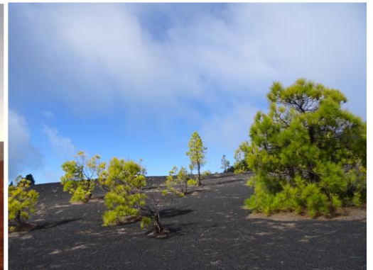
火山丘のカナリアマツ

トレッカーのパラダイス、カナリア諸島には美しく多様な風景があふれています。鬱蒼とした月桂樹の森から、奇岩が連なる火山の月世界、ドラマチックな断崖や海岸線まで変化に富んだ自然環境。年間を通して安定した温暖な気候に加え、独特で豊かな食文化。ナショナル・ジオグラフィックが「2020年に訪れるべき場所」のリストにカナリア諸島を選んだのも不思議ではありません。この魅力あふれる島々を、思う存分楽しむ様々なトレッキングコースが整備されています。心優しいカナリア人が迎えて