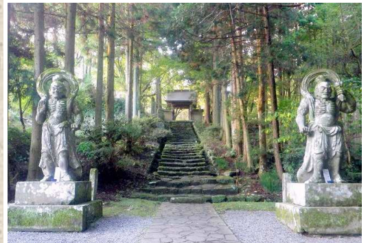
↑六郷満山の総寺院、両子寺の山門に威風堂々と立つ仁王像(1日目)

多くの山々が連なる国東半島に古来より息づいてきた山岳信仰。そこに奈良から平安時代、仏教と神道(宇佐八幡信仰)が融合し、独特の山岳仏教文化「六郷満山」が生まれました。その修行として行われたのが険しい岩峰や山道を縫って歩く「峯入(みねいり)」と呼ばれる難行です。この峯入コースを基本にハイキングルートとして整備されたのが「国東半島峯道ロングトレイル」で、熊野古道に匹敵する歴史古道として今、注目されています。当ツアーでは全 10 区間のトレイルの中から、国東半島の山深い絶景、由緒ある歴史や文化に触れる2コースを歩きます。