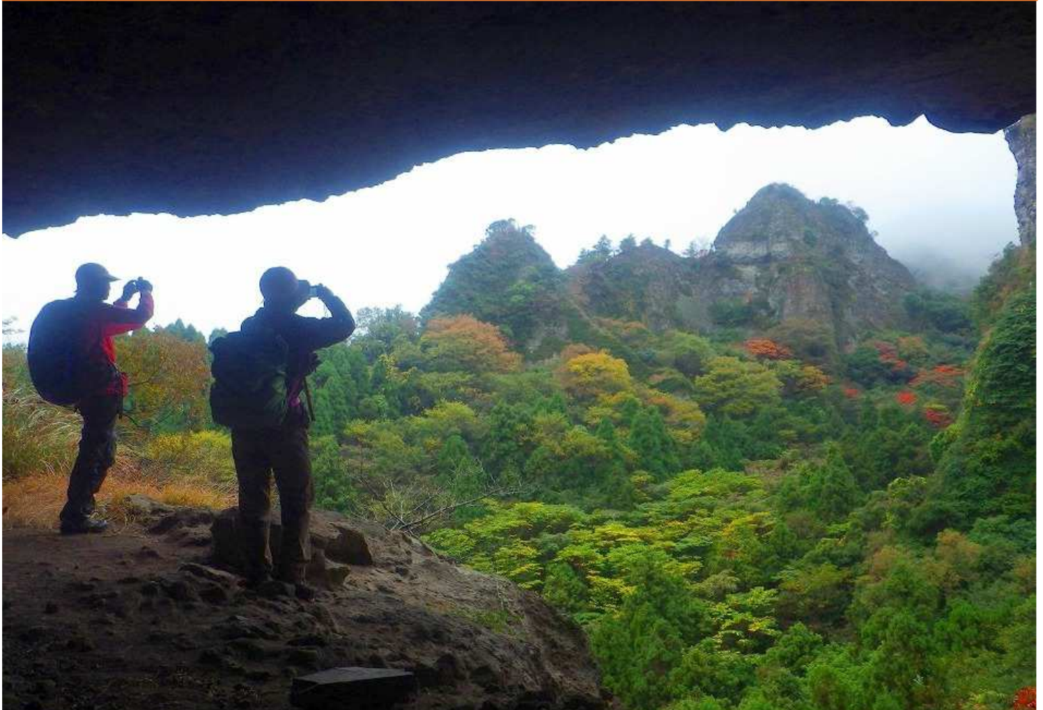
K-1 コースの最大の見どころのひとつ、大不動岩屋からはスケールの大きい岩峰群の絶景が見渡せます(2日目)

旅行代金 お一人様 180,000円 (新千歳発着) 160,000円 (羽田発着) 130,000円 (大分発着)