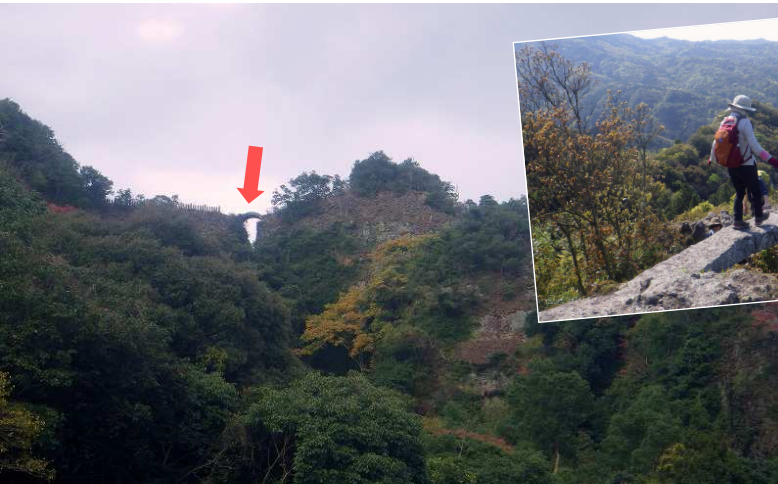
↑切れ落ちた岩の間にかかる峯入り行場のひとつ天念耶馬の無明橋(3日目・条件が良ければ希望者をご案内)