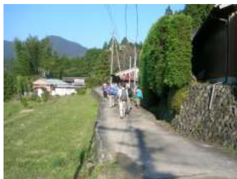
ひっそりした集落を通る