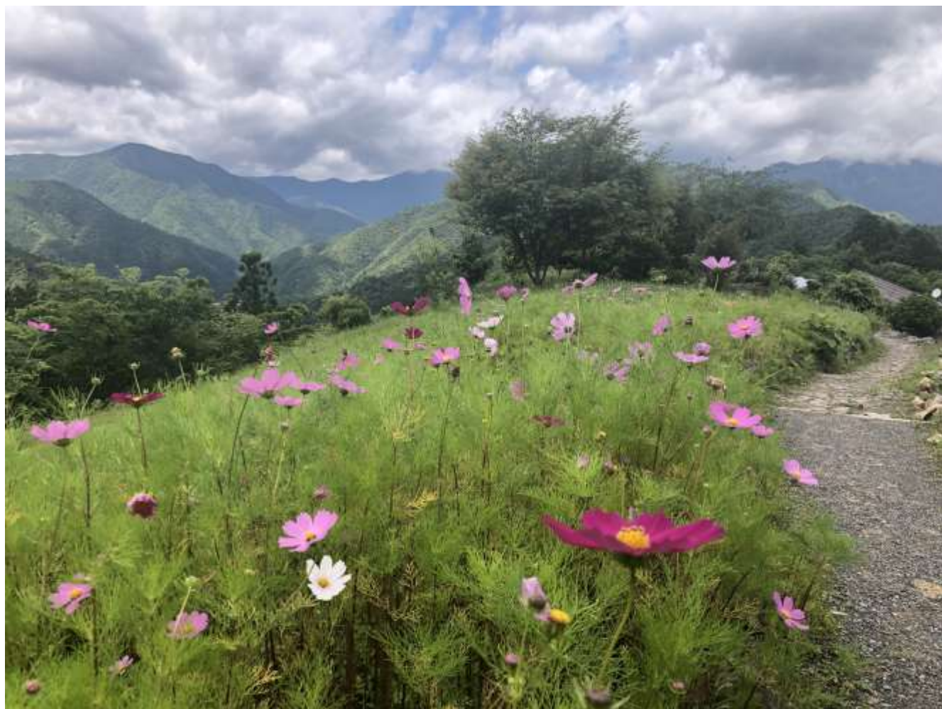
果無(はてなし)集落付近の風景