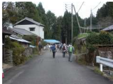
集落の路地を抜けて