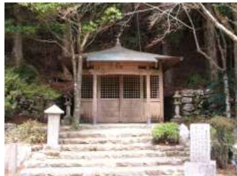
小さな寺社も多い