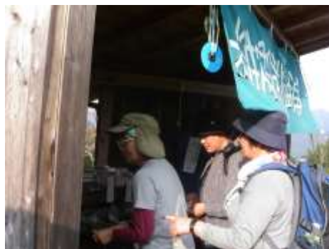
集落の無人販売にて