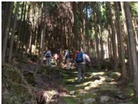
杉林の苔むした石段を登る