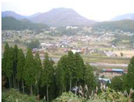
集落を望む場所で