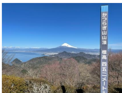
葛城山山頂と富士山