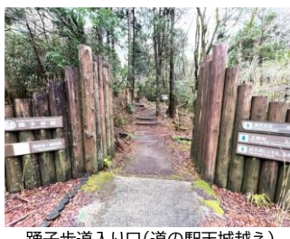
踊子歩道入り口(道の駅天城越え)