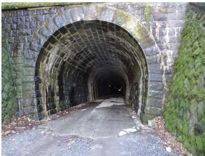
天城山隧道(旧天城トンネル)