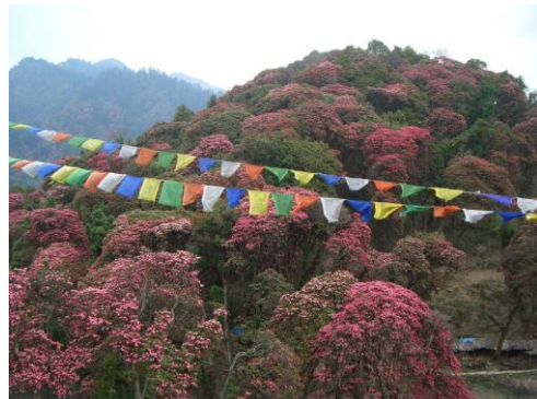
山全体がしゃくなげに覆われる