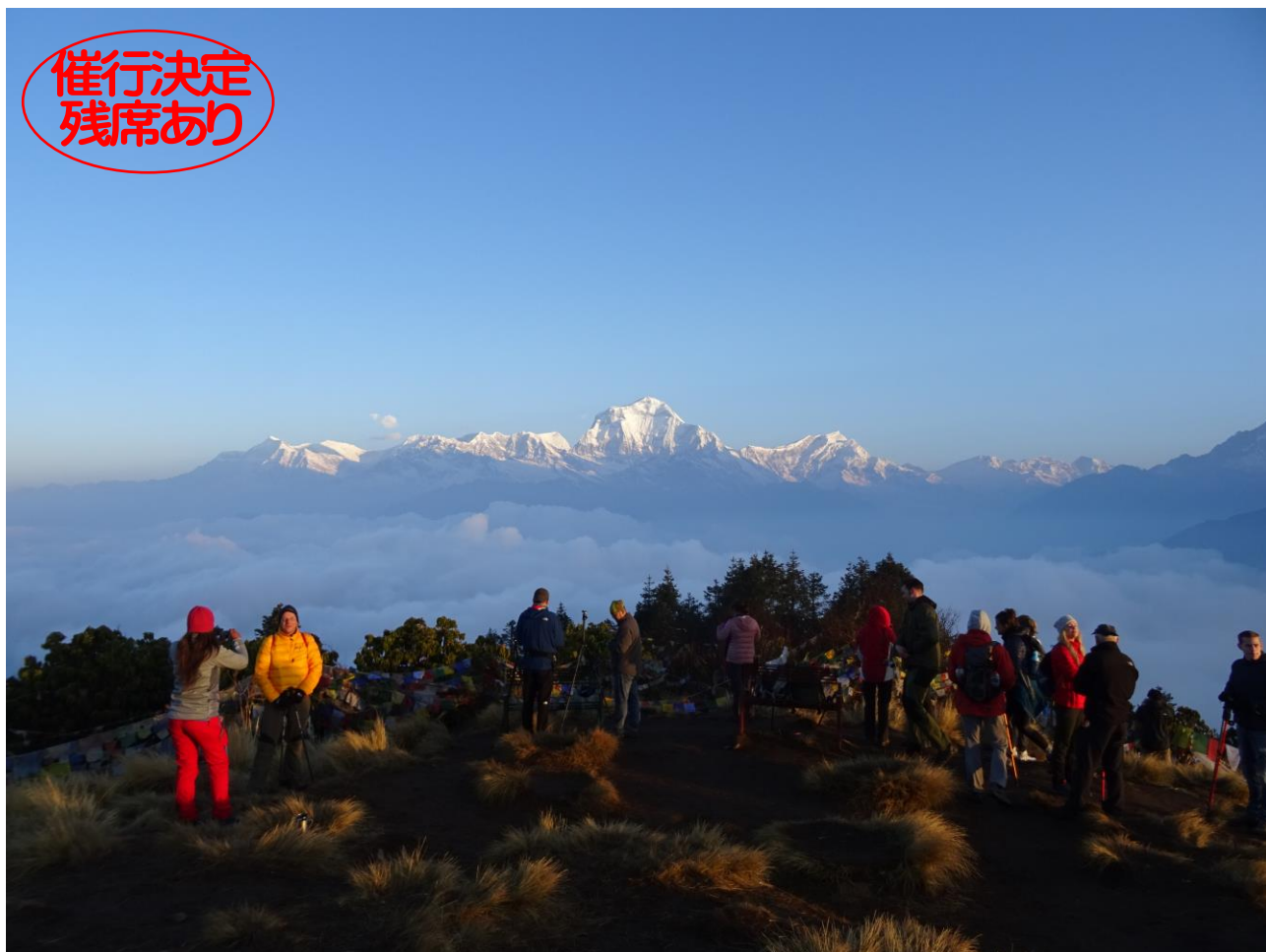
ブーンヒル頂上から望むとダウラギリ山群