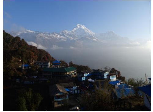
アンナプルナサウスとタダバニ村