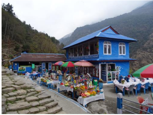
村のロッジはレストランも兼ねている