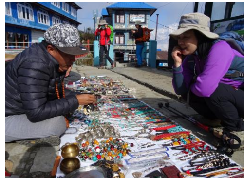
チベットの行商人と商談中