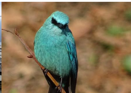
美しい野鳥も多い