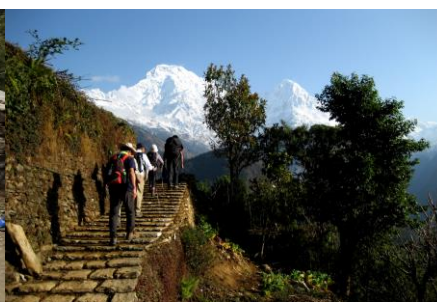
石段の街道とアンナプルナサウス峰