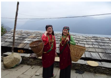
グルン族の民族衣装を試着

※宿泊地は上記を予定しておりますが、天候やロッジの混雑状況など現地事情によって変更する場合があります。あらかじめご了承ください。