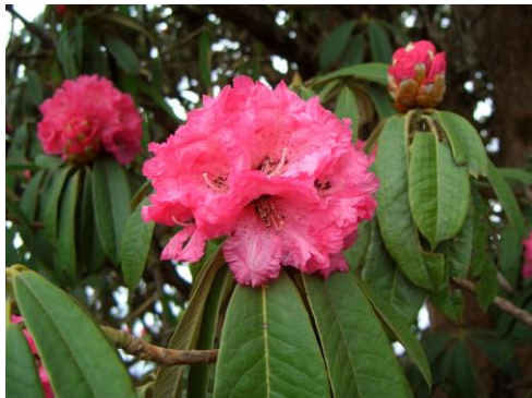
直径10cm以上の大きな花をつける