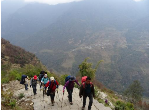
石段の登りを行う(ガンドルン付近)