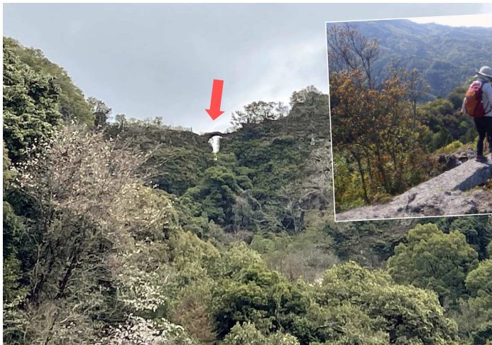
↑切れ落ちた岩の間にかかる峯入り行場のひとつ天念耶馬の無明橋(3日目・条件が良ければ希望者をご案内)