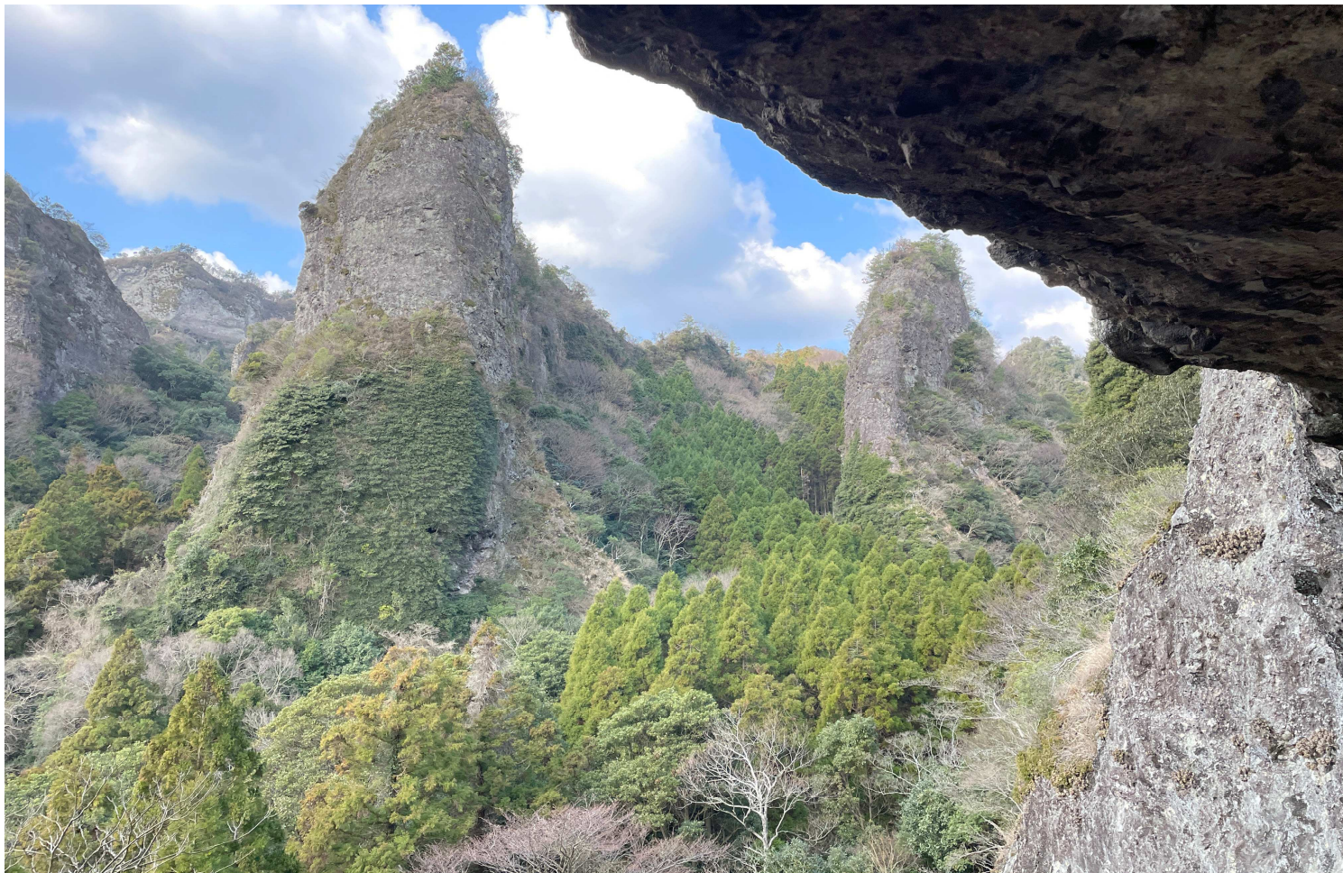
K-1コースの最大の見どころのひとつ、大不動岩屋からはスケールの大きい岩峰群の絶景が見渡せます(2日目)

旅行代金 一人様 180,000円 (新千歳発着) 160,000円 (羽田発着) 140,000円 (大分発着)