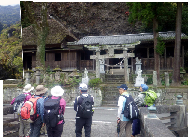
↑トレイル中には古刹、古社、石仏がいたるところに残ります(写真は天念寺 / 3日目)